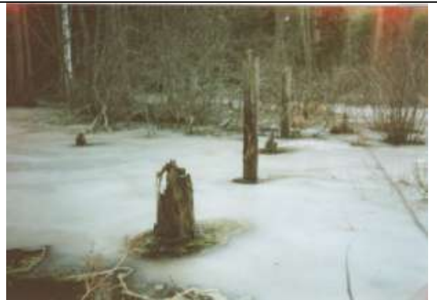
Tegelbruket Sågsten. Stolpar i vattnet efter en gammal bro för transport av lera från ett lertag i skogen mellan Sågsten och Storbyn.

AB Torö Taktegel hade som mest omkring 50-talet anställda. Arbetstiden var från sju på morgonen till fem på eftermiddagen med en halvtimmes frukostrast mitt på dagen. Tillverkningen upphörde redan 1925 då kvalitén på leran blev allt sämre. Man hade också en hel del reklamationer att brottas med samtidigt som kundunderlaget sviktade. Tegeltillverkning var i mycket ett säsongarbete med drift under sommarhalvåret för att sedan ligga nere under den kalla årstiden. Vintertid hade man endast några få anställda på plats som utförde underhållningsarbeten på pannor och maskiner men också för att lagra upp de mängder ved som behövdes för tegelbränningen. Vedåtgången i bränningsugnen var nämligen enorm.