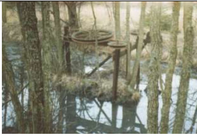
Tegelbruket Sågsten. Gammalt vindhjul i skogen mellan Sågsten och Storbyn. Här gick förr linbanan för transport av lera till tegelbruket.